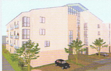
Neunkircher Innenstadt im Bereich Goethestraße/Kleiststraße (ehem. Holzhandlung Ruess)

Multifunktionales Stadthaus mit Wohn- und Gewerbeflächen